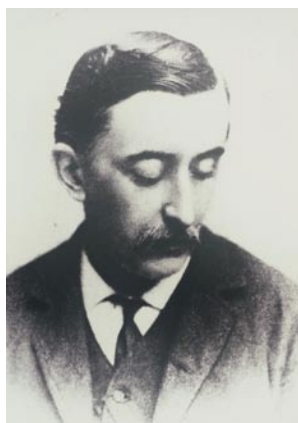
▲ ラフカディオ・ハーン