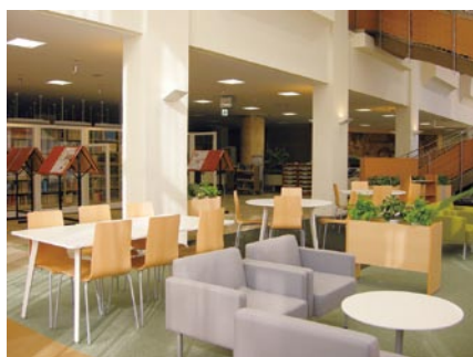
▲ リフレッシュ・コミュニケーションゾーン (中央図書館)