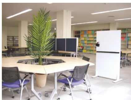
▲ アクティブ・ラーニングゾーン (中央図書館)