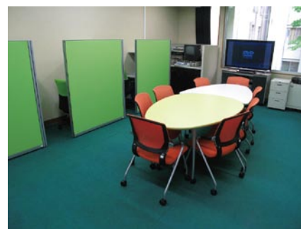
▲ 多目的室 (医薬学図書館)