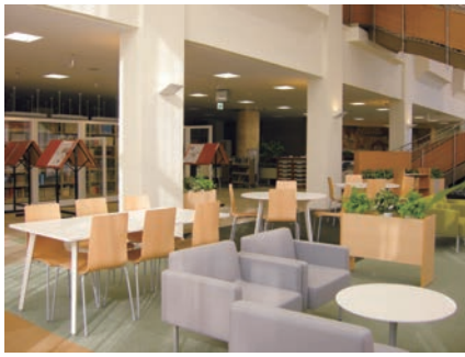
▲ リフレッシュ・コミュニケーションゾーン (中央図書館)