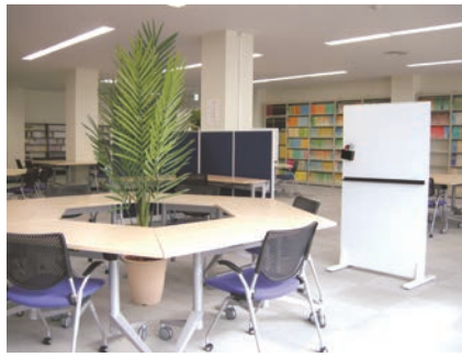
▲ アクティブ・ラーニングゾーン (中央図書館)