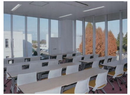
▲ グループ学習室 (医薬学図書館)