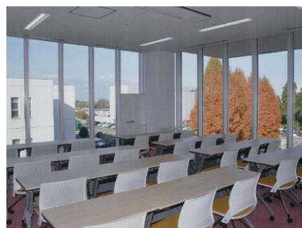
▲ グループ学習室 (医薬学図書館)