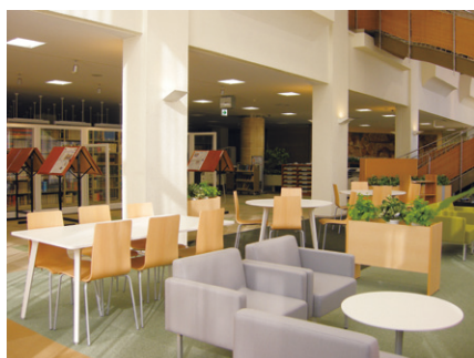
▲ リフレッシュ・コミュニケーションゾーン (中央図書館)