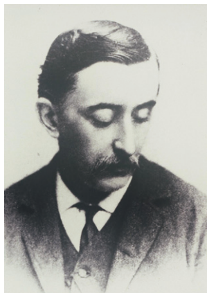
▲ ラフカディオ・ハーン